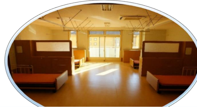
2階 従来型居室(4人部屋・2人部屋)

明るく、広い居室・食堂 入居者お一人おひとりの 状況にあった入浴設備を 完備しております。