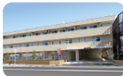
玲光苑習志野ローズ館

所在地 千葉県習志野市屋敷4-6-6 TEL 0476-493-8021 FAX 0476-493-8020