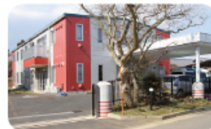
まんざきの家玲光苑

所在地 千葉県習志野市谷津3-14-7 TEL 0476-407-3600 FAX 0476-407-3628